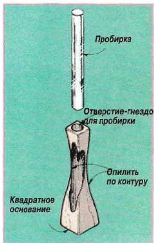
Рис. 1. Ваза состеклянной пробиркой